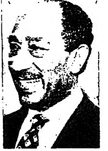
كان لقاء سعادة ممثل الرئيس محمد أنور السادات السيد سعد الدين مرتضى بأسرة جريدة «الانباء» يوم الأحد الماضي حدثاً فريداً من نوعه.